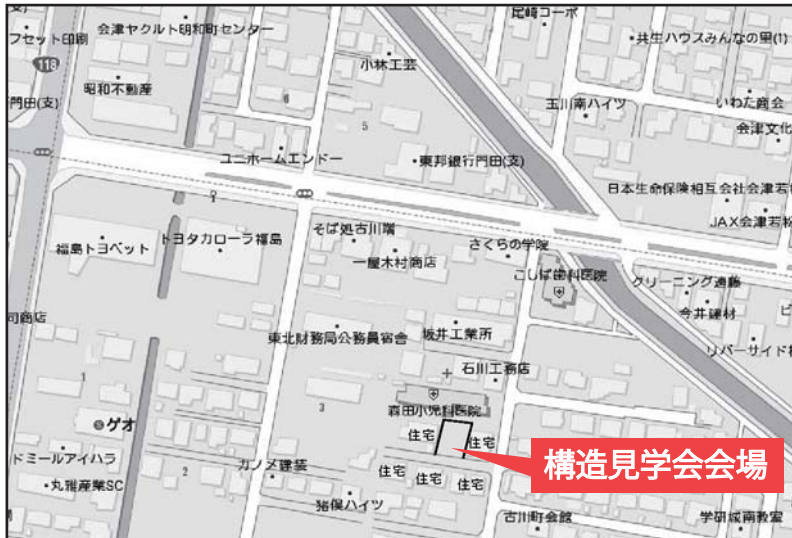
開催場所：会津若松市古川町地内（森田小児科医院様南隣）